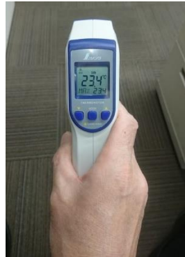
●非接触で測定できる放射温度計です。